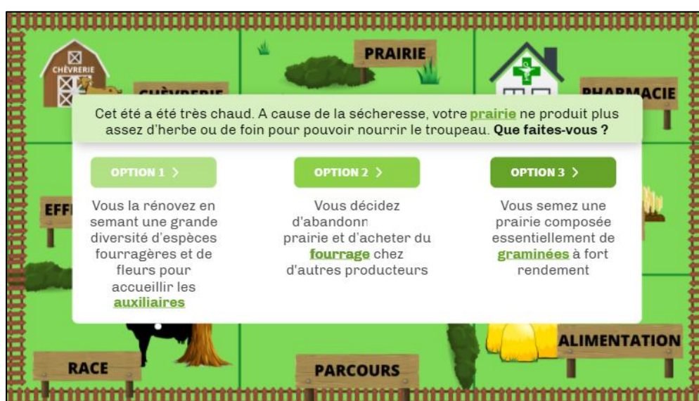
Figure 3 - Exemple de point de débat dans Ma ferme a d'incroyables talents

Dans l'exemple du jeu de débat Ma ferme a d'incroyables talents , le but est de construire une ferme durable. Pour cela les joueurs ont le rôle d'associés d'une ferme, et doivent prendre des décisions en commun (parmi trois choix proposés pour chaque atelier de la ferme, figure 3). Si les joueurs ont des connaissances sur le sujet, ils peuvent débattre en utilisant leurs connaissances personnelles. Dans ce cas, l'animateur a surtout un rôle de modérateur, passant la parole d'un joueur à l'autre. A l'inverse, si les joueurs ont peu ou pas de connaissances sur le sujet, ils risquent de débattre en s'appuyant sur des idées préconçues (faute de connaissances). De plus, s'ils n'osent pas poser de questions, les joueurs risquent de passer à côté des connaissances transmises par le jeu et d'être surpris par les résultats observés en fin de partie. L'animateur doit bien connaître les éléments à apporter au débat pour repérer ceux qui n'ont pas été énoncés par les joueurs et intervenir pour guider ces derniers.