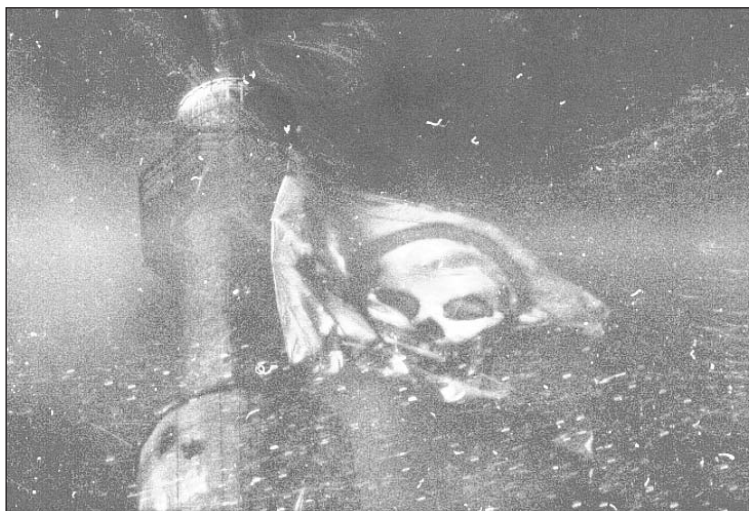
Schroder M/ Argus Bios

d'une « activité qui met en interaction plusieurs acteurs qui, confrontés à la fois à des divergences et à des interdépendances, choisissent (ou trouvent opportun) de rechercher volontairement une solution mutuellement acceptable » (Dupont 1994 p. 11) ? D'un côté, ce n'est pas le cas. En effet, la procédure française qui conduit à définir et localiser un incinérateur est essentiellement administrative et judiciaire. Elle repose sur les délibérations des collectivités territoriales et locales, sur l'instruction administrative d'un projet, suivie d'une enquête publique qui recueille des observations. L'ensemble débouche sur la délivrance d'une autorisation