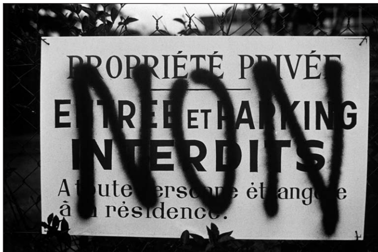
L'accumulation de plaintes de la part des habitants en raison des conflits, les réactions vives de certains usagers face à des aménagements et des arrêtés pris par le conseil municipal, l'apparition de clôtures ou de panneaux le long des propriétés sont autant de signes d'alarme persistants qui conduisent les élus à augmenter leur engagement sur ce type de dossiers.

" Le PNR, je pense que c'est peut-être un avantage, pas sur toute la ligne, pour éviter ces pressions de la périphérie de Paris, pour conserver notre village comme il est. J'ai peur que des gens arrivent. Il ne faut pas être trop égoïste... un certain partage